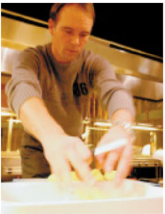
Im Stress: Der Adiamo-DJ gibt die Kartoffeln in die Schüssel.