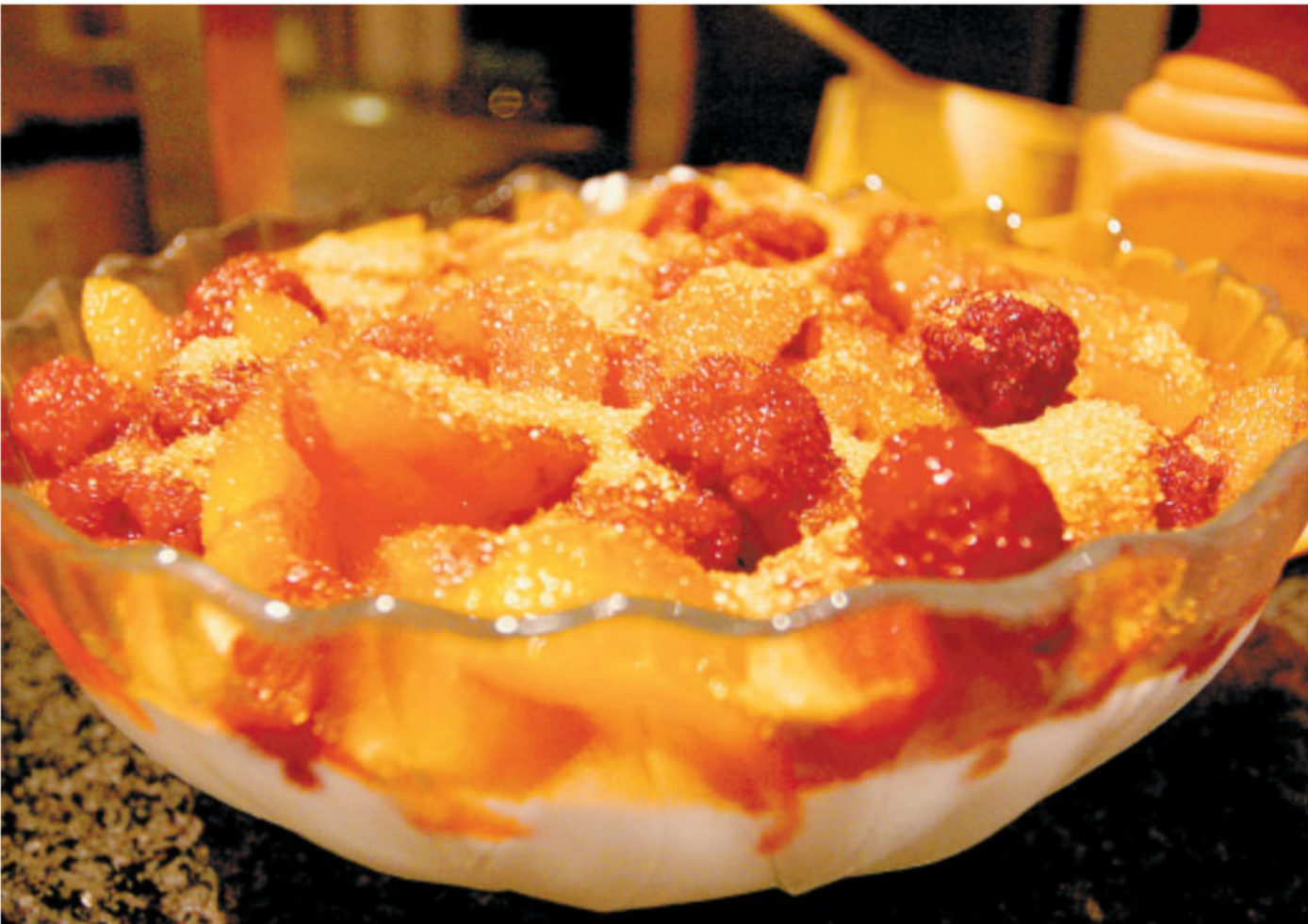
Süßes zum Dessert: Der türkische Früchtejoghurt ist eine willkommene Abwechslung zur Roten Grütze, die gern serviert wird. Der Joghurt ist fruchtig, frisch und sicherlich auch im Sommer ein Gedicht.